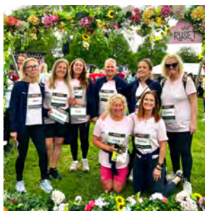
28 maj Våra kvinnliga medarbetare deltar i Våruset.

94,4% TYCKER att det finns bra möjligheter till KÄLLSORTERING.