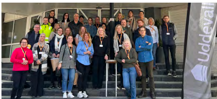
16 april Tillsammans med Sveriges Allmännyttan fick vi äran att arrangera en nätverksträff för ombyggnadssamordnare från hela landet.