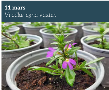
11 mars Vi odlar egna växter.