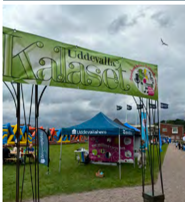
25-27 juli Uddevallahem huvudsponsor för Uddevallahemskalaset.

173 har odlat med Urban Gardening 2024 DELTA G A R E