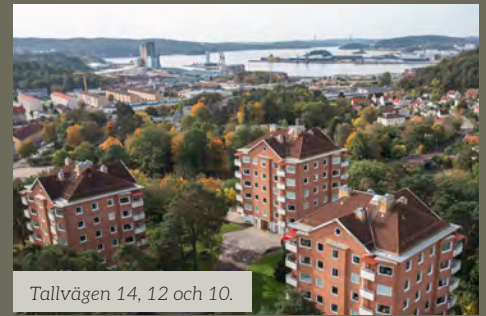
Tallvägen 14, 12 och 10.