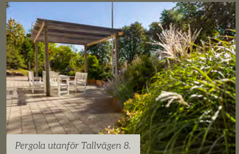
Pergola utanför Tallvägen 8.