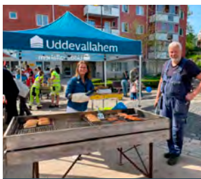
28 maj Tureborgsdagen