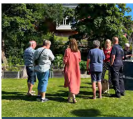
26 juni Första Uddevallahem på plats-träffen på Bohusgården.