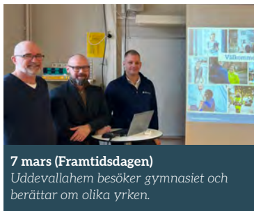
7 mars (Framtidsdagen) Uddevallahem besöker gymnasiet och berättar om olika yrken.

Som vanligt har vi på Uddevallahem haft ett händelsefyllt år tillsammans med er. Här är en återblick från vårt 2024!