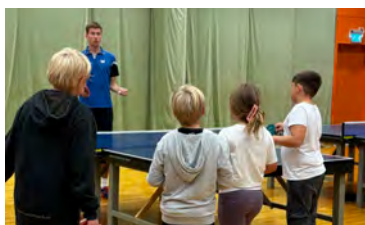
9 okt Prova-på-pingis-kväll med Uddevalla BTK.