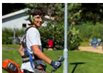
Juni-augusti Sommarjobbarna på plats.

173 har odlat med Urban Gardening 2024 DELTA G A R E