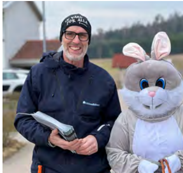
27 mars Påskharen var på besök och delade ut godis i våra områden.