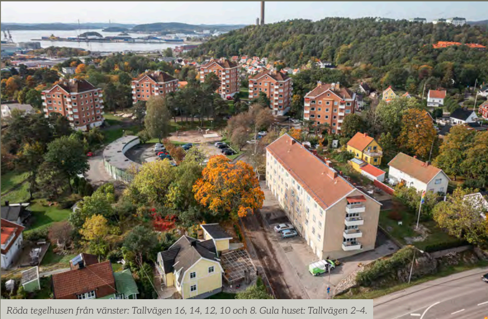
Röda tegelhusen från vänster: Tallvägen 16, 14, 12, 10 och 8. Gula huset: Tallvägen 2-4.