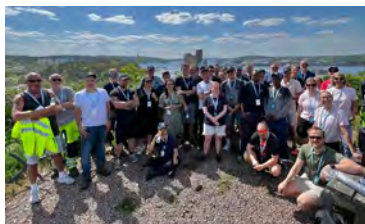
16 maj Vi promenerar Walk of Hope till förmån för barncancerfonden.

94,7% tycker att de får ETT BRA BEMÖTANDE av bovärderna*.